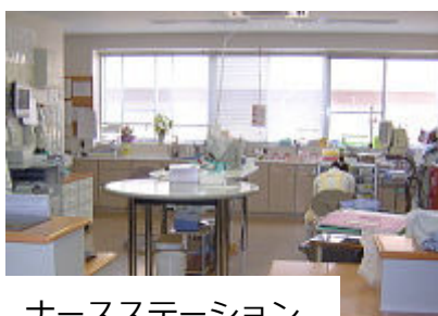
ナースステーション