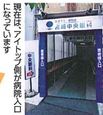
平成24年末完成予定